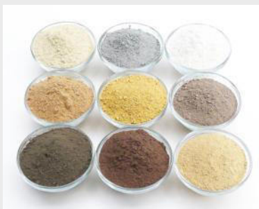
Na-Bentonite und div. Tonmehle