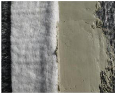
Einstreichen der Überlappungen von Bentonitmatten