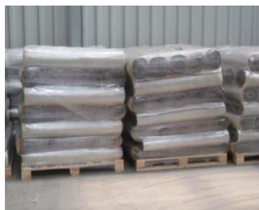
Bentonitmatte 1,10x5 m "Piccolo"