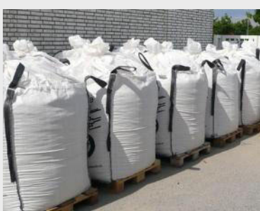
Mehle, Granulate und Pellets in Big Bags