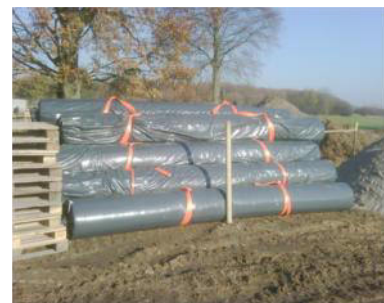
Bentonitmatte Standard 5x40 m