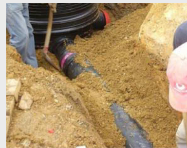
Einkapselung von Rohrleitungssystemen