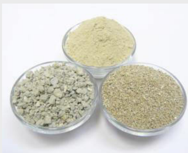
Ca-Bentonit als Mehl und Granulat