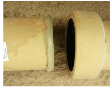
verwendbar als Gleitmittel