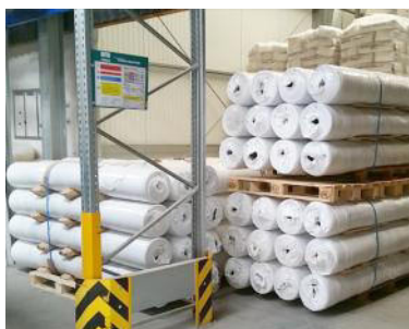
Bentonitmatte 2,50x10 m "Medio"