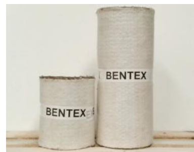
Sonderformate und Streifen

Geosynthetische Tondichtungsbahnen, auch "Bentonitmatten" genannt, sind geotextile Verbundstoffe, die seit Jahrzehnten mit Erfolg als natürliche Abdichtungen in verschiedensten Anwendungsgebieten eingesetzt werden. Rollenmaße: 5x40 m (Standard); 2,50x10 m (Medio); 1,10x5 m (Piccolo), Streifen