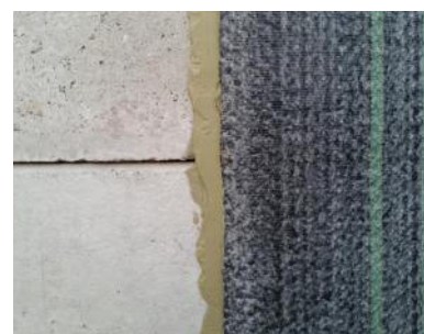
Anschluss Bentonitmatte an ein Bauwerk

BENTOPAST Bentonitpasten kommen u.a. bei der Verlegung von Bentonitmatten zur Behandlung der Überlappungen zum Einsatz. Feststoffreich und aus natürlichen Komponenten, liegen die Vorteile der Verwendung eines gebrauchsfertigen, definierten Produktes auf der Hand.