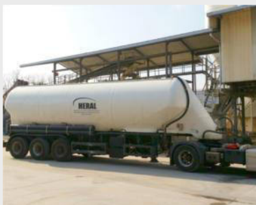
Pulverprodukte lose per Silo-LKW