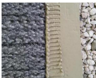
Fixierung Bentonitmatte auf unebenem Untergrund