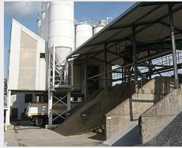
diverse Bunker für Sande, Kiese und Splitte