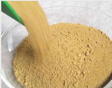
Mischung "M9" für Rohraufleger im Deponiebau