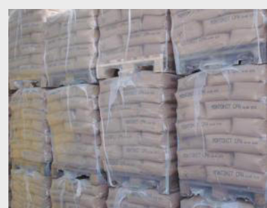
Mehle, Granulate und Pellets als Sackware

HERAL führt neben hochquellfähigen Natrium-Bentoniten auch mäßig quellende Calcium-Bentonite, sowie Tonmehle ganz ohne Quellfähigkeit. Unsere Kundschaft beliefern wir mit loser Ware per Silo-LKW, Mehlen und Granulaten in Big Bags oder als Sackware.