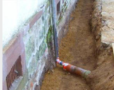
"Braune Wanne" an Bauwerken