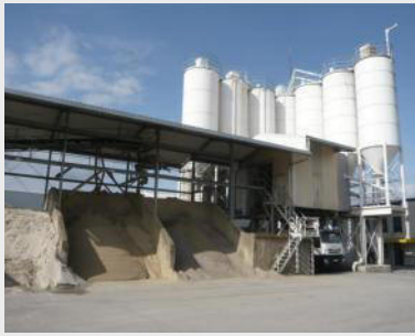
Mischanlage mit Silos für Trockenzuschläge

definierte Dichtmischungen aus natürlichen Rohstoffen