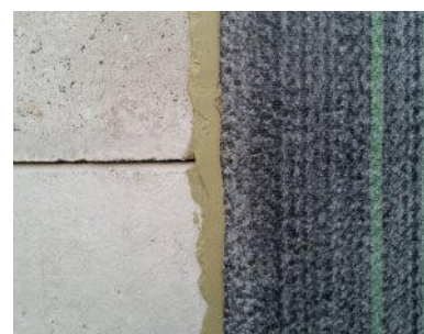
Anschluss Bentonitmatte an ein Bauwerk

BENTOPAST Bentonitpasten kommen u.a. bei der Verlegung von Bentonitmatten zur Behandlung der Überlappungen zum Einsatz. Feststoffreich und aus natürlichen Komponenten, liegen die Vorteile der Verwendung eines gebrauchsfertigen, definierten Produktes auf der Hand.