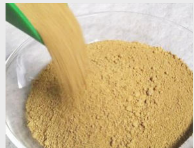
Mischung "M9" für Rohraufleger im Deponiebau

Unsere mineralischen Dichtmischungen werden aus natürlichen Kies-, Sand-, Schluff- und Tonfraktionen komponiert. HERAL produziert eine Vielzahl definierter, qualitätsüberwachter Standardmischungen, sowie Auftragsmischungen nach Vorgaben unserer Kunden.