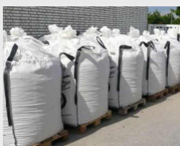
Mehle, Granulate und Pellets in Big Bags