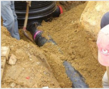
BENTOFILL zu Einkapselung von Rohrleitungssystemen

definierte Dichtmischungen aus natürlichen Rohstoffen