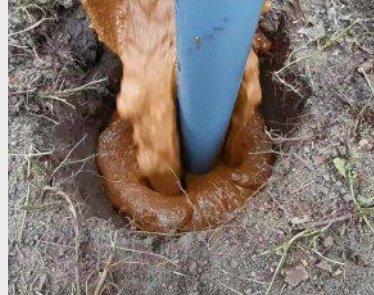
DiMax Mischungen für quellfähige Dichtmassen