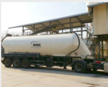
Pulverprodukte lose per Silo-LKW