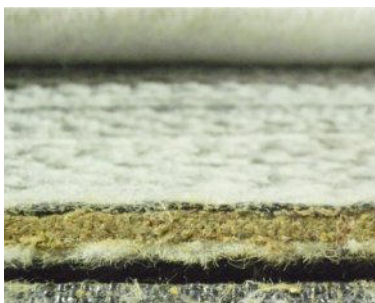
Schnitt durch eine Bentonitmatte

"Bentonitmatten" zur Abdichtung im erdberührten Bereich