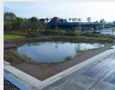
ÖkoPond ökologische Dichtung für Teiche und Fließgewässer