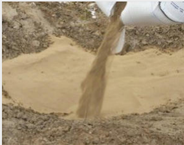
QuellMix DS/CP Quellsande und Quellkiese