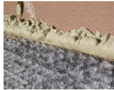
Einsatz gegen Hinterläufigkeiten