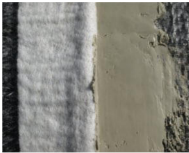
Einstreichen der Überlappungen von Bentonitmatten