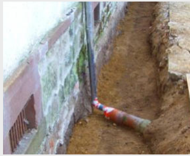
BENTOFILL für Braune Wannen in der Bauwerksanierung